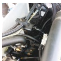
zugänglich und sauber verarbeitet

Satz- und Druckfehler, sowie technische Änderungen vorbehalten.