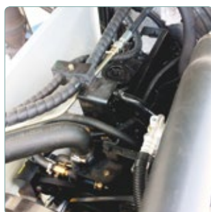
zugänglich und sauber verarbeitet